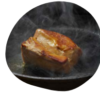
Foie gras poêlé Foie gras poêlé minute accompagné : gros sel, baies roses et cacao, confiture de figues et d'oignons, assortiment de toasts