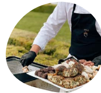
Les grillades du chef Mini brochettes cuites à la plancha (mini saucisse, caillette, boudin, andouillette, volaille)