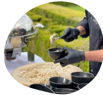
Meule de parmesan Risotto sauce vin jaune cuisiné dans une meule de parmesan