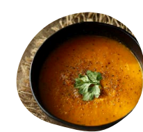
Chaudron Velouté de potimarron à l'huile de noisette et concassé de châtaigne aux graines de courge