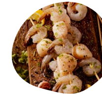
Mini brochettes de la mer Cuisson de St Jacques et Gambas sur plaque de sel de l'Himalaya