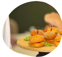
USA Mini hamburger de bœuf Mini hot dog (porc ou volaille) Ketchup - Mayonnaise - Moutarde