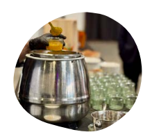
Soupe froide Légumes du soleil marinés au citron et grillés sur plaque de sel d'Himalaya