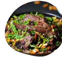
Poêlée Asiatique Légumes cuits à la vapeur et poêlés minute Viande : volaille et bœuf Sauce soja et cacahuètes concassées