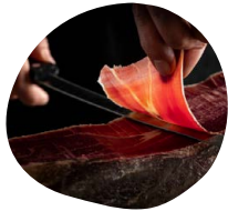
Découpe de jambon Serrano Jambon Serrano découpé minute

Nous pouvons vous proposer un atelier culinaire en supplément de votre prestation