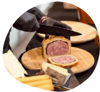
Découpe Pâté en croûte Découpe de pâté en croûte artisanal Volaille à la graine de moutarde et forestier