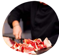
Découpe Pata Negra Découpe de jambon Pata Negra minute