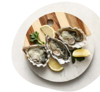
Stand de l'écailler Huitres ouvertes accompagnées de vinaigre à l'échalote, citron, pain de seigle, beurre demi-sel