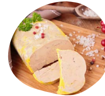
Découpe terrine de foie gras Terrine de foie gras accompagnée : gros sel, baies roses et cacao, confiture de figues et d'oignons, assortiment de toasts