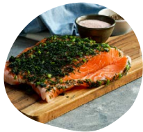
Découpe de poissons Découpe de poissons marinés et fumés, tranchés minute (saumon, flétan, truite selon arrivage) Citron, sel de Guérande, beurre salé, chantilly aux herbes Assortiment de toasts