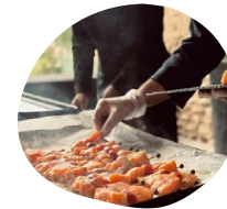
Plancha de la mer Rouget, pétoncles et crevettes cuites à la plancha, Poivrons, fenouils, aubergines et courgettes Huile d'olive, aioli, rouille